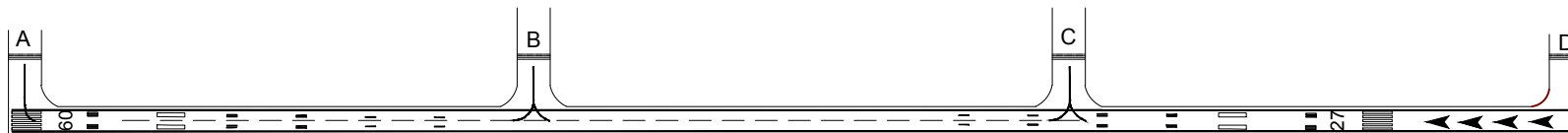
ILUMINACION RWY 09/27 Y SALIDA TWY - LIGHTING RWY 09/27 AND EXIT TWY